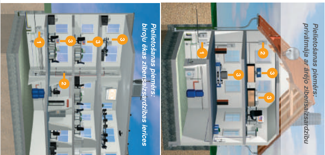
Pielikšanas piemērs: Prtvānējā ar ārējo zibenssaiņisardzību