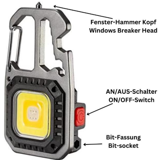
Fenster-Hammer Kopf Windows Breaker Head

The lamp must be in accordance with the country specific Regulations at a suitable disposal point for the recycling of electrical and electronic equipment.