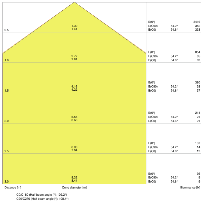
LDC typ cone